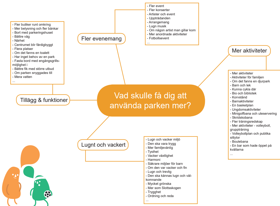
Diagrammet ovan är en sammanställning av de önskemål som framkom i intervjuer med medborgarna.

Parkens identitet behöver stärkas för att få fler att vistas här och för att Mölndalsborna ska kunna känna sig stolta över sin stadspark. Det kan göras med hjälp av en medveten gestaltning och ett attraktivt innehåll. Speciella inslag - tex en skulptur, landmärke eller något som knyter an till platsens eller Mölndals historia - kan bidra till att skapa djup och få platsen att utmärka sig. Platsskapande aktiviteter och marknadsföring kan användas för att öka kännedomen om platsen, stärka invånarnas relation till parken och skapa ett positivt rykte.