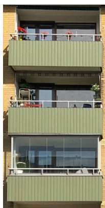
Balkonger i dov färg.