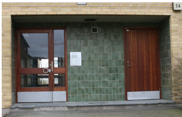
Entréparti med keramiska plattor.