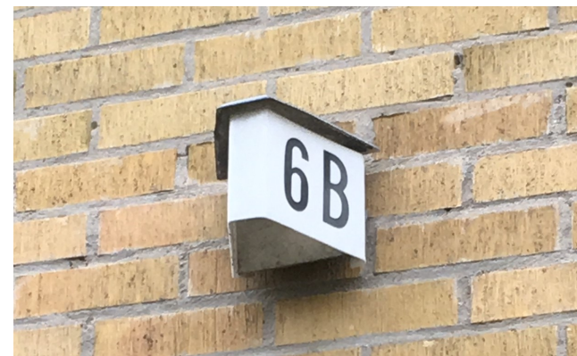
Tidsmarkör - nummerskylt.