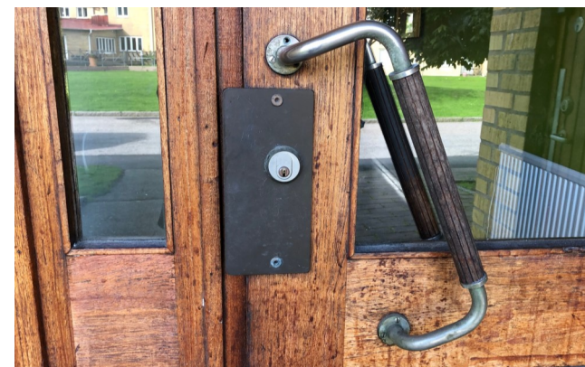
Tidsmarkör - handtag och dörr av trä och glas.