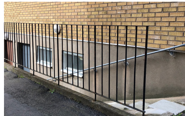
Tidsmarkör - staket.

Tillkommande komplementbyggnader ska smälta in och ta hänsyn till befintlig bebyggelse när det gäller placering och utformning. Utgå från de ursprungliga materialen och färgerna i området och behåll gårdarnas öppenhet.