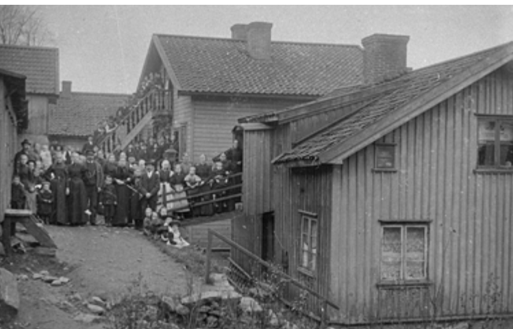
Bostadshus i Kvarnbyn, ca år 1910–1920.

Flera familjer bodde i samma hus och alla hade en egen ingång. De som bodde överst fick en bro från berget till ytterdörren.