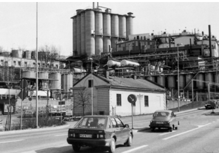
Kvarnbygatan och SOAB omkring år 1990. Den stora silon revs 2009.

På 1970-talet blev det kris i textilindustrin och många fabriker stängdes. Samuelssons strumpfabrik var den sista textilindustrin i Kvarnbyn. Strumpfabriken stängdes år 1982.