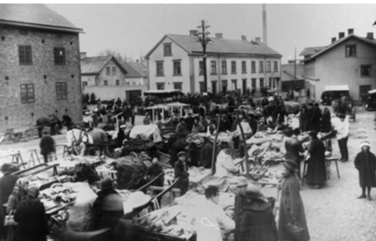
Torghandel, ca år 1910.

I Kvarnbyn växte ett eget litet samhälle med bland annat affärer, skolor och sjukhus fram.