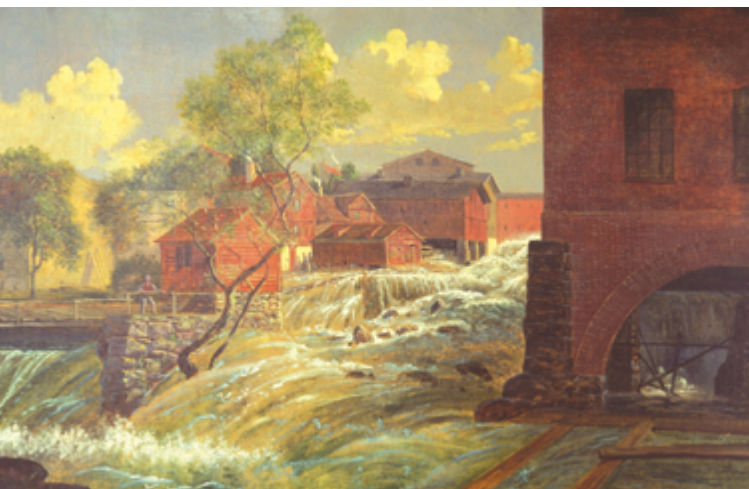
Oljemålning från år 1868. Konstnär: Ludvig Messman

Efterhand började fler verksamheter att använda vattenkraft. Även industrier som inte malde mjöl kallades för kvarnar.