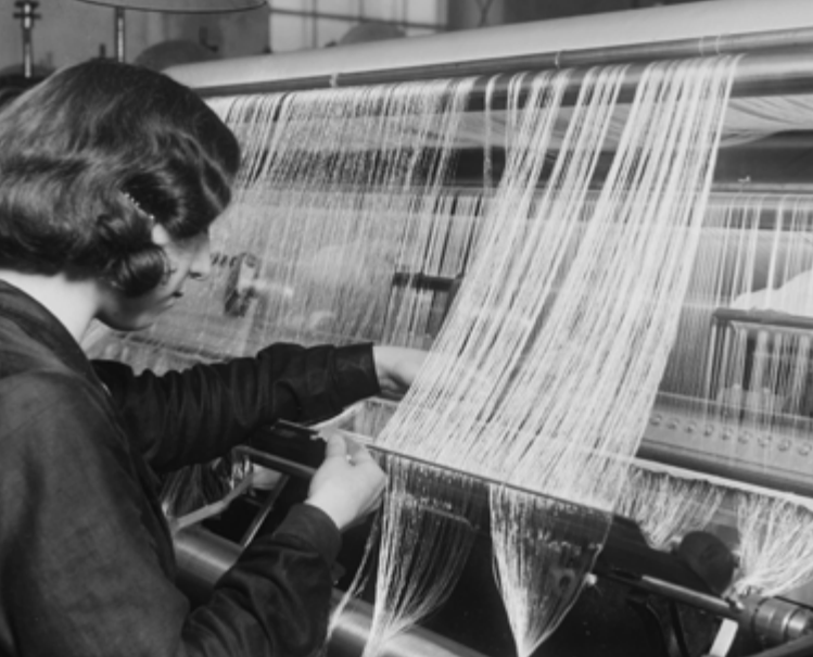
Kvinna vid textilmaskin på Stora Götafors.